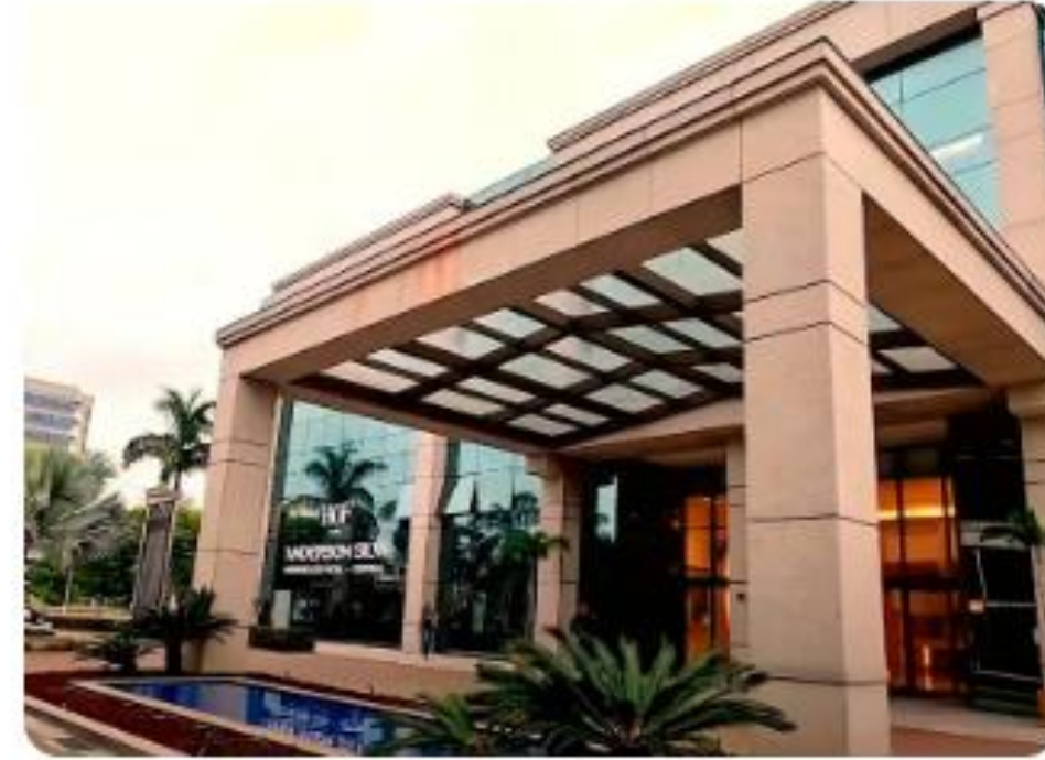
Barra da Tijuca - Rio