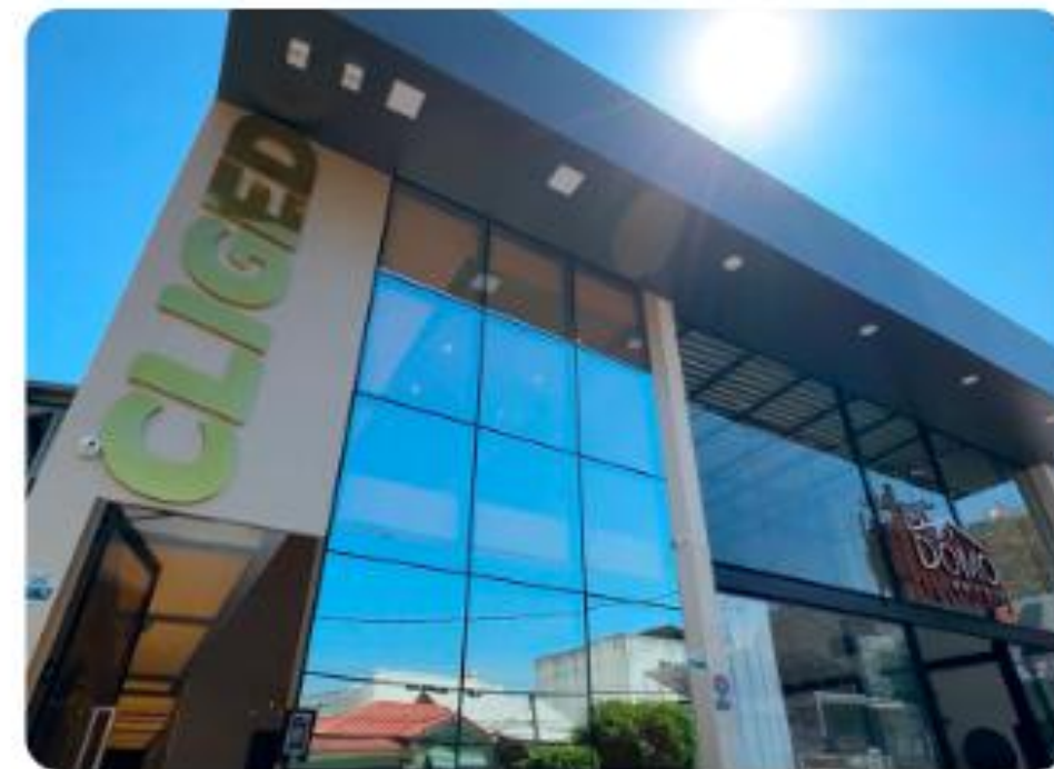
Campos dos Goytacazes