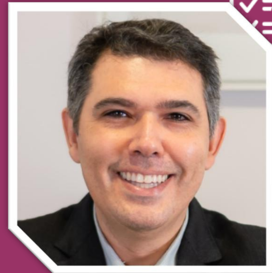
PI: Dr. Flávio Ribeiro

Estudo: Estudo: Série de Casos para avaliar a Resposta Clínica de anticorpos monoclonais anti CD20 após linfodepleção em pacientes com Nefrite Lúpica