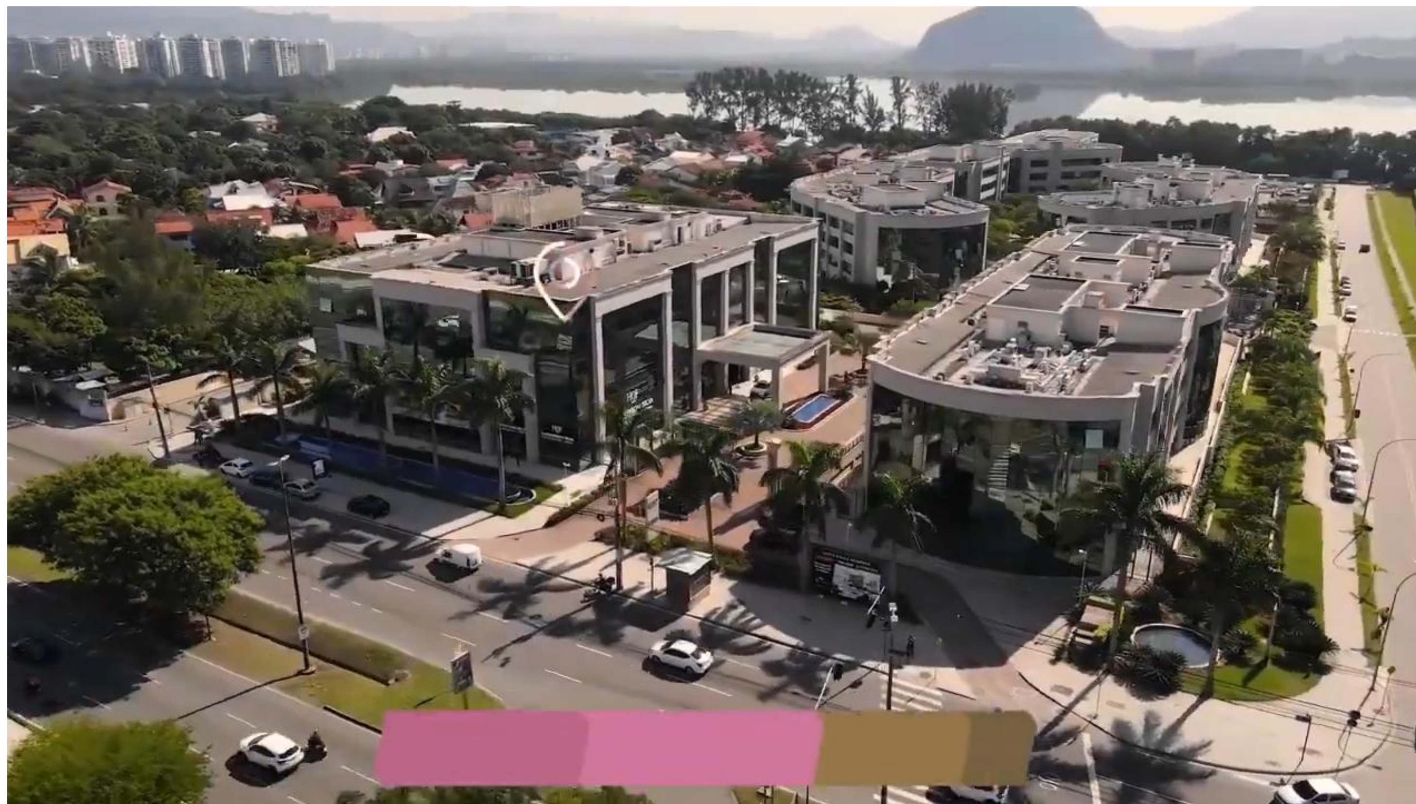
UNIDADE BARRA DA TIJUCA - RIO